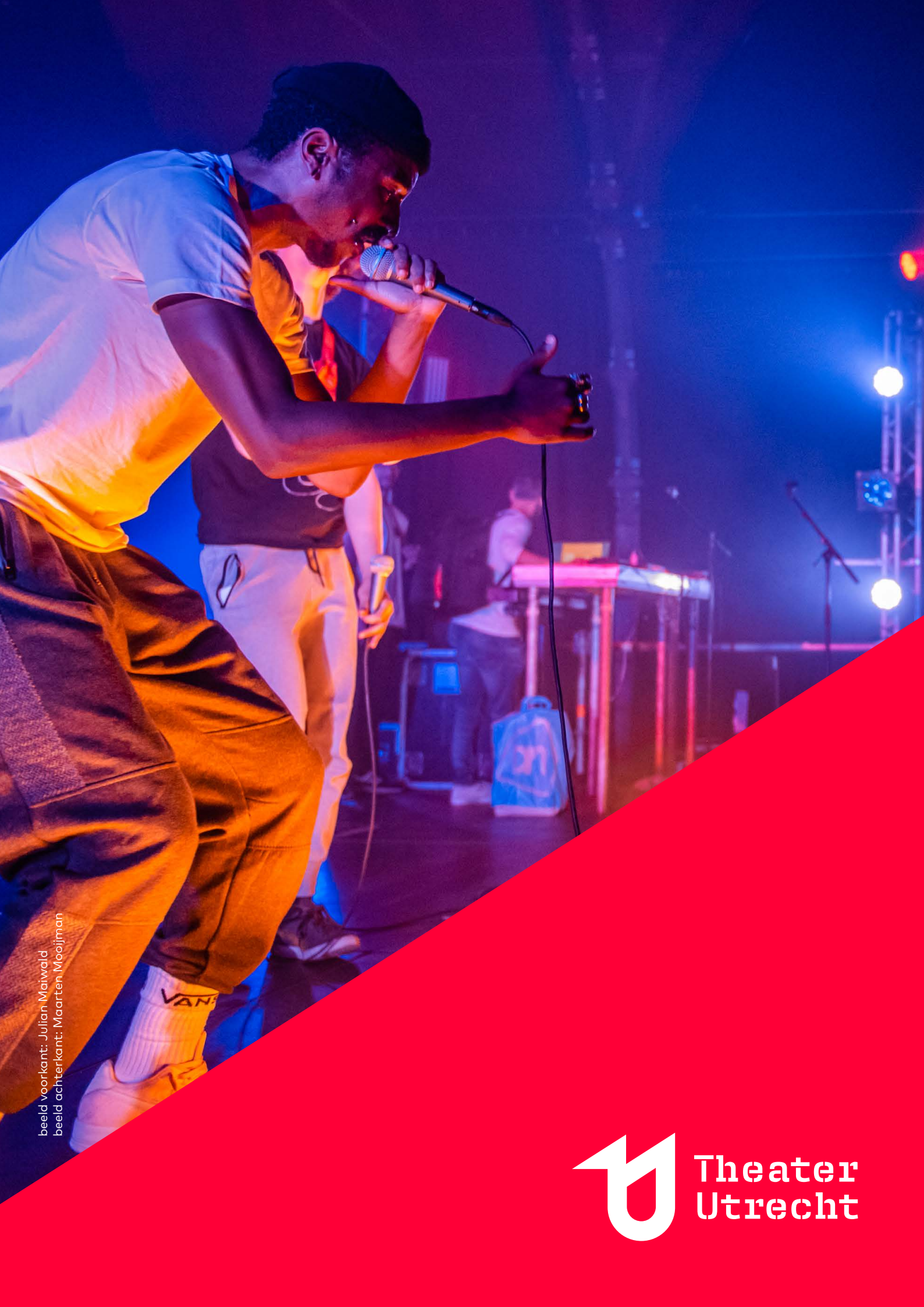
beeld voorkant: Julian Matwald beeld achterkant: Maarten Mooijman